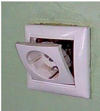
Sérült, balesetveszélyes fali elektromos csatlakozó aljzat